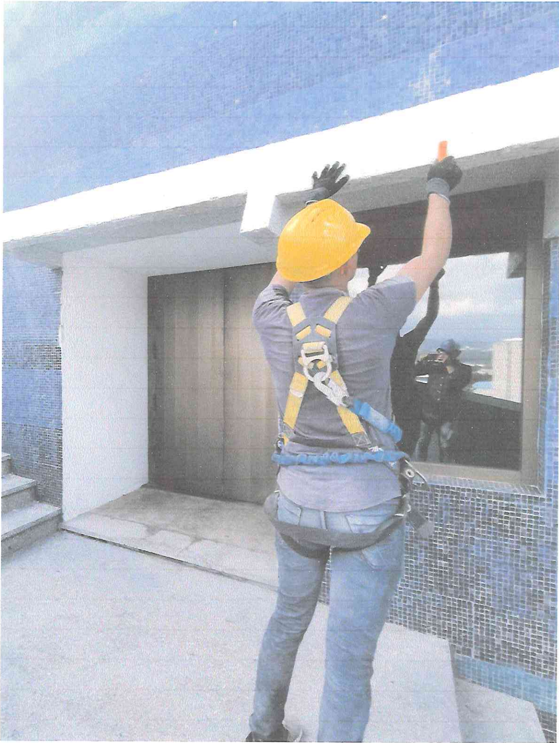
Limpieza y desinfección de teselas en segmento A5 de la fachada Oriente.