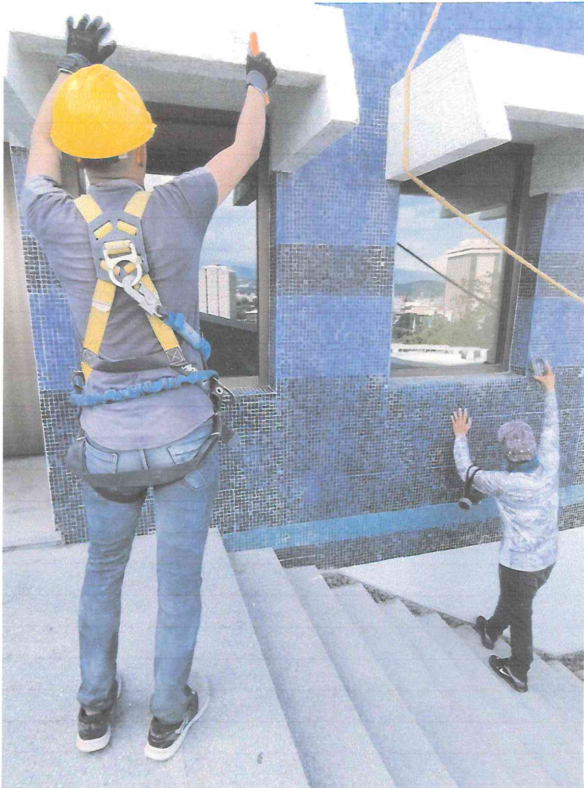
Limpieza y desinfección de teselas en segmento A5 de la fachada Oriente.